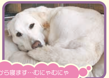
今から寝ます…むにゃむにゃ